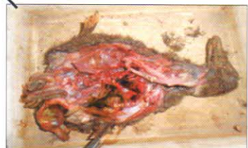
আক্ৰান্ত হাঁহৰ তেজ, নাড়ী-ভুৰি খাদ্যৰ লগত মিহলি হৈ এই ভাইৰাছ বিয়পে