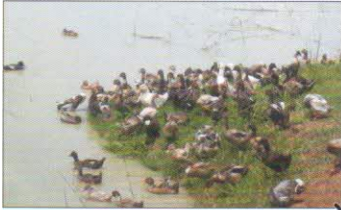
আক্ৰান্ত হাঁহৰ মল-মূত্ৰ যোগে চৰণীয়া জলাশয়, ঘাঁহ-বন, ভাইৰাছৰ দ্বাৰা দূষিত হয়

ডাকপ্লেগ ৰোগৰ ভাইৰাছ আক্ৰান্ত হাঁহৰ মল-মূত্ৰ যোগে তথা ঠোঁট আৰু নাকৰ পৰা ওলোৱা পানীৰ লগত বহিঃ নিৰ্গত হয়। বহু সময়ত বনৰীয়া হাঁহে এই ৰোগৰ ভাইৰাছ দেহত কঢ়িয়াই লৈ মল-মূত্ৰযোগে খাল-বিলৰ পানীত বা চৰণীয়া অঞ্চলত ৰোগৰ বীজাণু বিয়পাই থৈ যায়। ঘৰচীয়া হাঁহবোৰে ডাকপ্লেগ ভাইৰাছ মিহলি হৈ থকা জলাশয়ৰ পানী নতুবা পুখুৰীৰ পাৰৰ পৰা আহাৰ বিচাৰি ফুৰোতে সহজে এই ভাইৰাছ আয়ত্ব কৰে। ইয়াৰোপৰি নাক আৰু চকুৰ পৰা ওলোৱা পানীৰ সংস্পৰ্শত সুস্থ হাঁহৰ দেহত ডাকপ্লেগ ভাইৰাছ প্ৰৱেশ কৰিব পাৰে। আক্ৰান্ত হাঁহৰ তেজ, নাড়ী-ভুৰি খাদ্যৰ লগত মিহলি হৈও এই ভাইৰাছ বিয়পে।