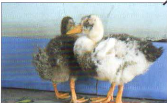
গৰালত, পথাৰত আক্ৰান্ত হাঁহৰ প্ৰত্যক্ষ সংস্পৰ্শত ভাইৰাছ বিয়পে