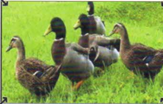
সুস্থ হাঁহৰ জাক