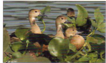
বনৰীয়া হাঁহে বিলৰ পানীত মল ত্যাগ কৰি ভাইৰাছ বিয়পায়